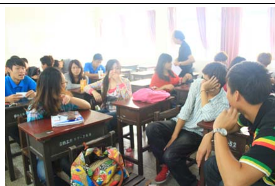
同學們的分組討論