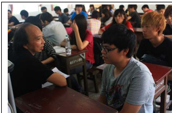
老師與同學課堂討論

本課程開設乃基於文化景觀保存與社區活化產學合作案的反思，在進行文化資產保存與再利用時，顯見在地居民與外來遊客對於在地文化的無視與無禮，在觀光休閒活動規模與發展日益擴大與蓬勃的今日，具有「玩」本質的休憩活動已然是日常生活的一部份，現代公民除了知道如何玩得舒服、講究品味之外，如何「玩得有格調、有責任」也必須是公民應有的素養，尤其在全球極力呼籲節能減碳，關注永續性的此刻，觀光休憩必須避免從「無煙囪工業」的佳譽落入「潛在耗能工業」的惡淵中，今日「休憩素養」的養成如同媒體素養一般重要，都是日常學習不可或缺的公民核心能力。而學生經過這堂課的學習，已經培養文化休憩素養的觀點，下面為學生參與課堂和課堂活動之照片：